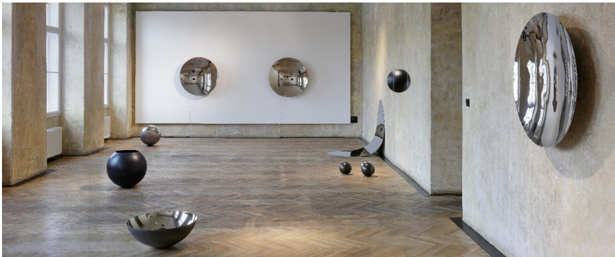
Pohled do instalace děl Vladimíra Škody v galerii Cermak Eisenkraft_ foto Martin Polák