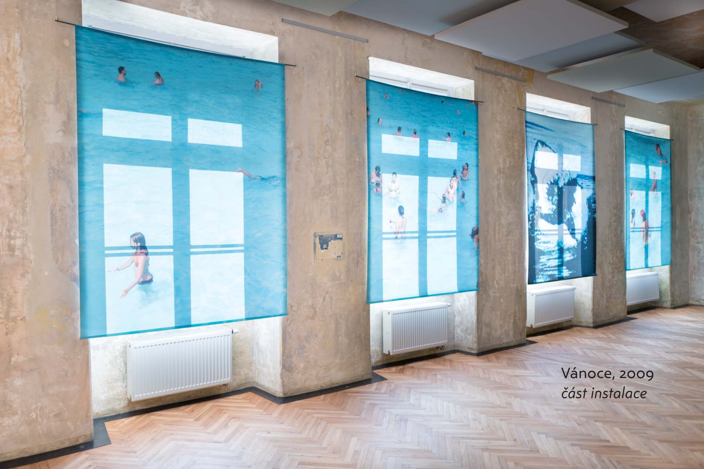
Vánoce, 2009 část instalace