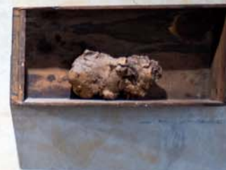
Přírodní přízrak, 1996