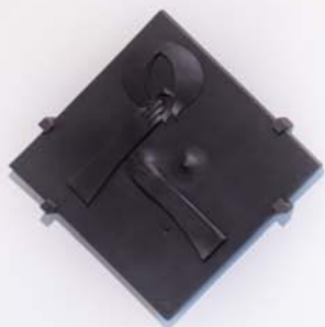
Přemítání I. /pocta pannám/, 2006