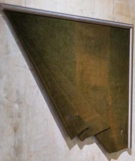
Chvíle ticha, 1999