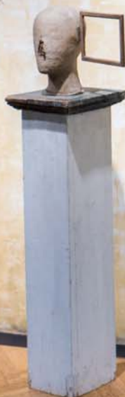
Hlava s rámečkem, 1979