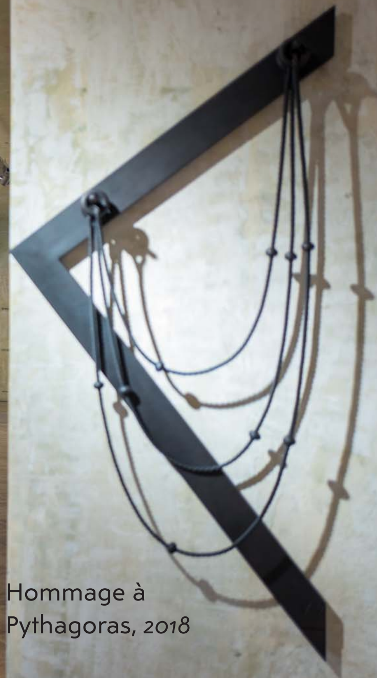
Hommage à Pythagoras, 2018