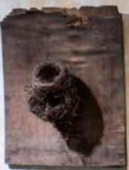
Hnízda, 1992 – 1996