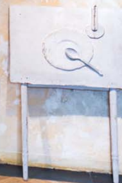
Vánoční stůl, 1969