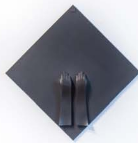
Gloves II., 2006