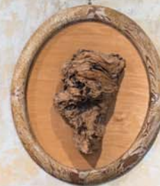
Dáma z lepší společnosti, 1992 - 1993