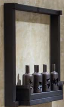
Hommage à G. Morandi, 2015