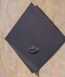
Slova lásky, 2002