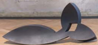
Femme couché, 2004