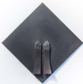
Gloves I., 2006