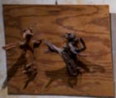
Dvě strašidla, 1992