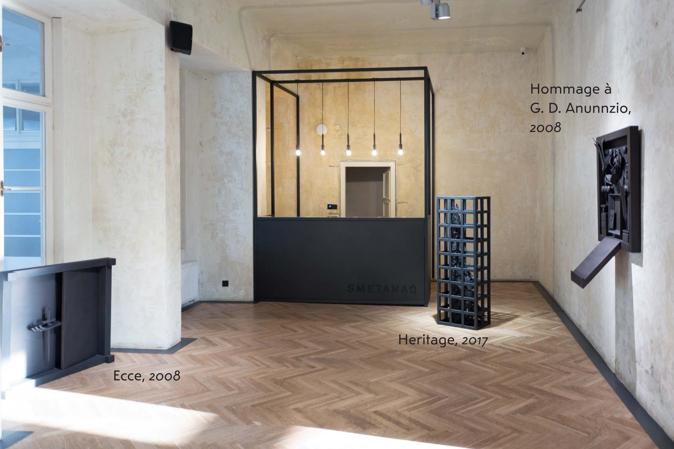
Hommage à G. D. Anunnzio, 2008